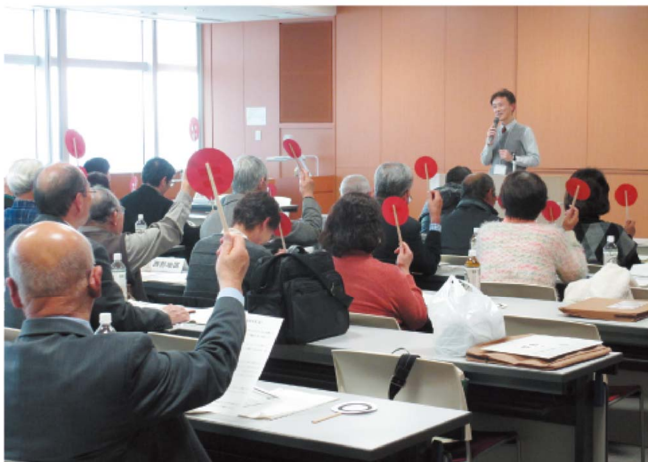
センター職員による出前講座の様子

鈴鹿亀山消費生活センターでは、消費者からの商品やサービスなど消費生活全般に関する苦情や問い合わせなどを、専門の相談員が受け付け、公正な立場で処理に当たっています。