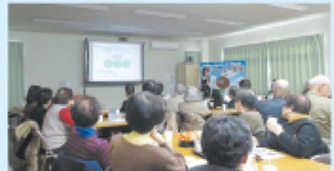
外部講師によるコーヒー講座の様子

実施例：有料老人ホームの基礎知識と賢い選び方、元気なうちから取り組む相続対策、コーヒー講座、基礎から学ぼう投資信託、子どもお金教室～貯金箱作り～、スマートフォン・携帯電話の正しい使い方 など